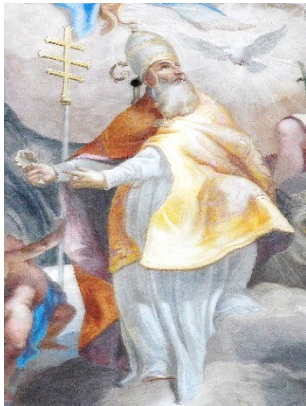
Fresko von S. B. Faistenberger (1729)